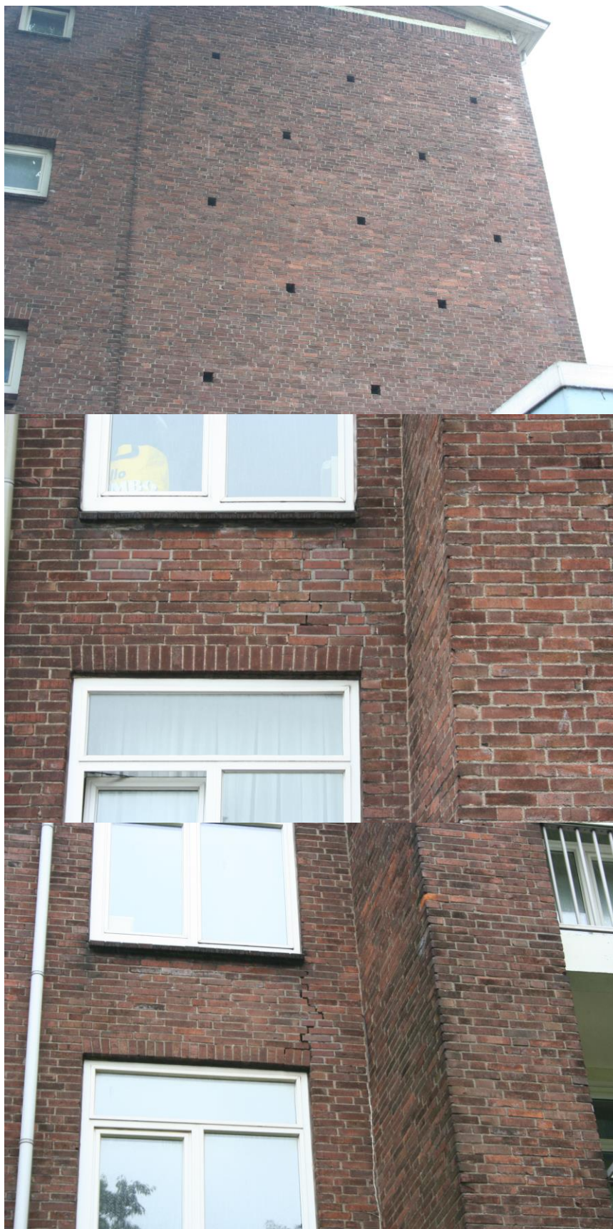
Invliegopeningen in de flat